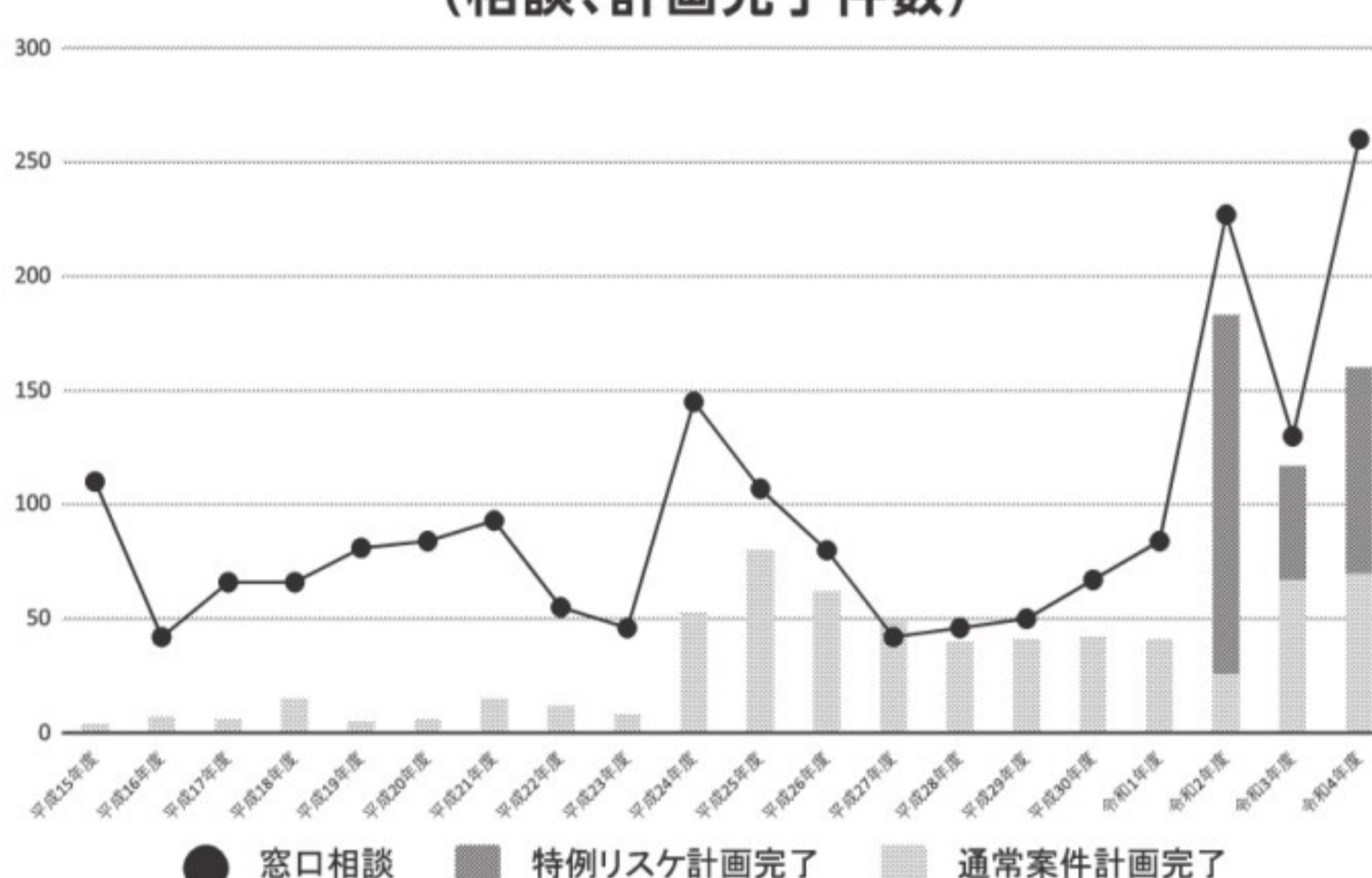
兵庫県中小企業活性化協議会の実績推移 (相談、計画完了件数)

猶予要請を早期に相談できたことが決め手になった。今後のコロナ禍からの出口では、売上が回復していかなくて、増大した借入金の返済をどのようにするかを考えると同時に、世の中の変化に即した事業の再構築を行っていく必要がある。そのためには「早期発見・早期決断」が重要だ。協議会のホームページをご覧ください、安心して相談してほしい。